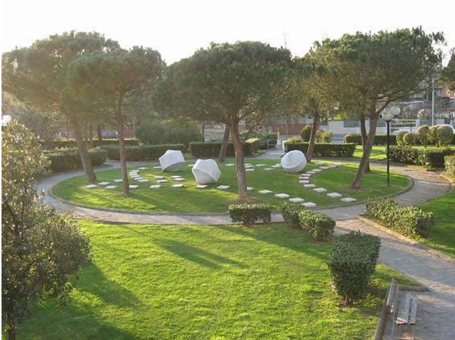
Trottole 2008 installazione permanente marmo CARRARA