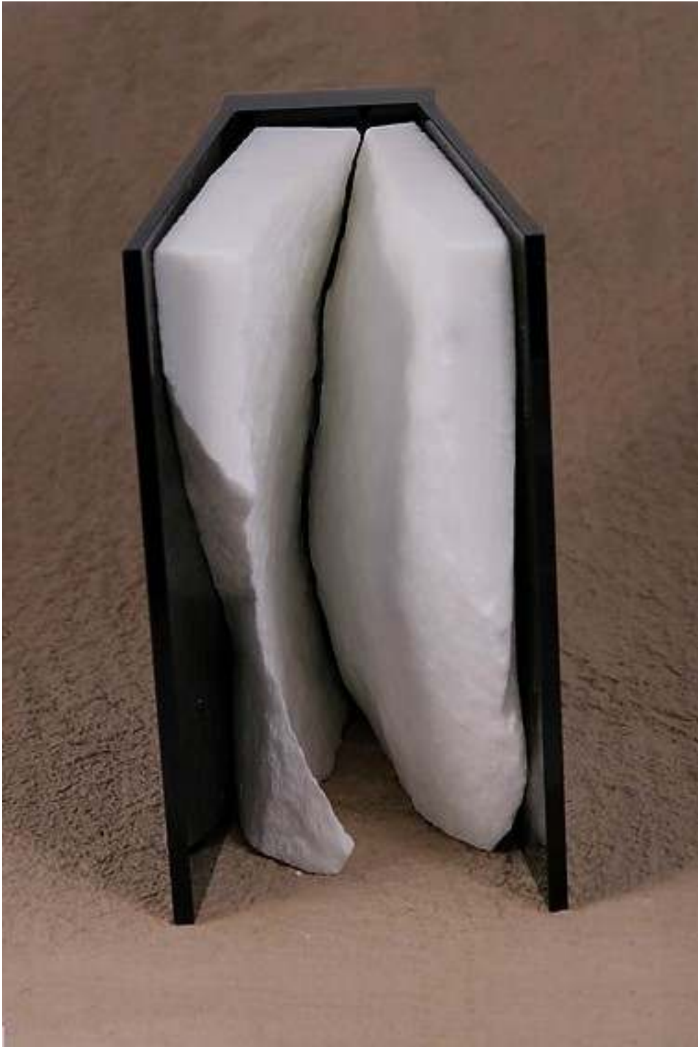
SENZA TITOLO 2009 cm15x15x5 marmo e plexiglas libro d'artista