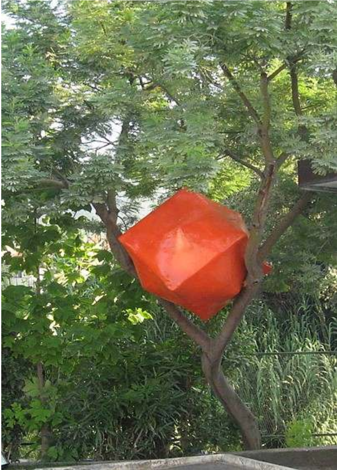
SENZA TITOLO 2008 cm 100x100x100 cartapesta installazione