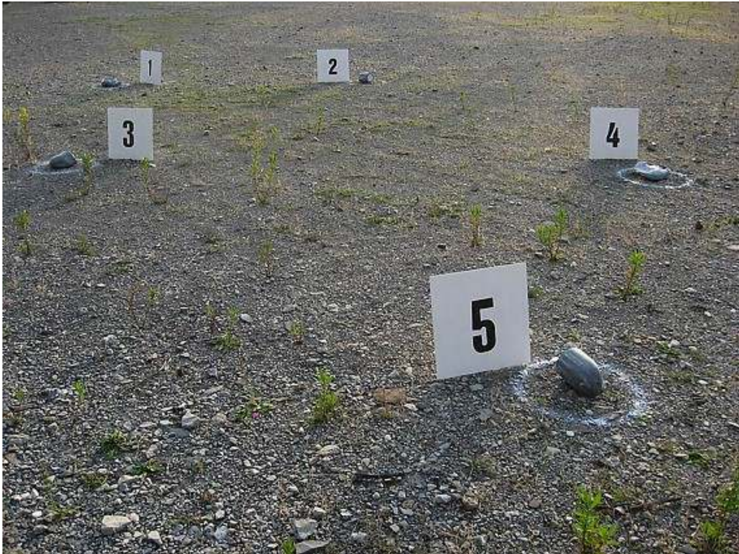
TI AMO, JE T'AIME, Y LOVE YOU. 2009 installazione marmo, acrilico e multistrato, dimensioni variabili