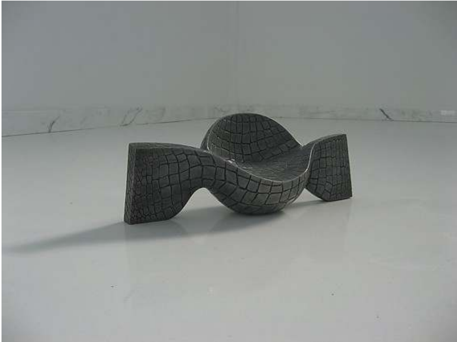
seduta Caramella 2008 studio per arredo urbano cm 51x19x16