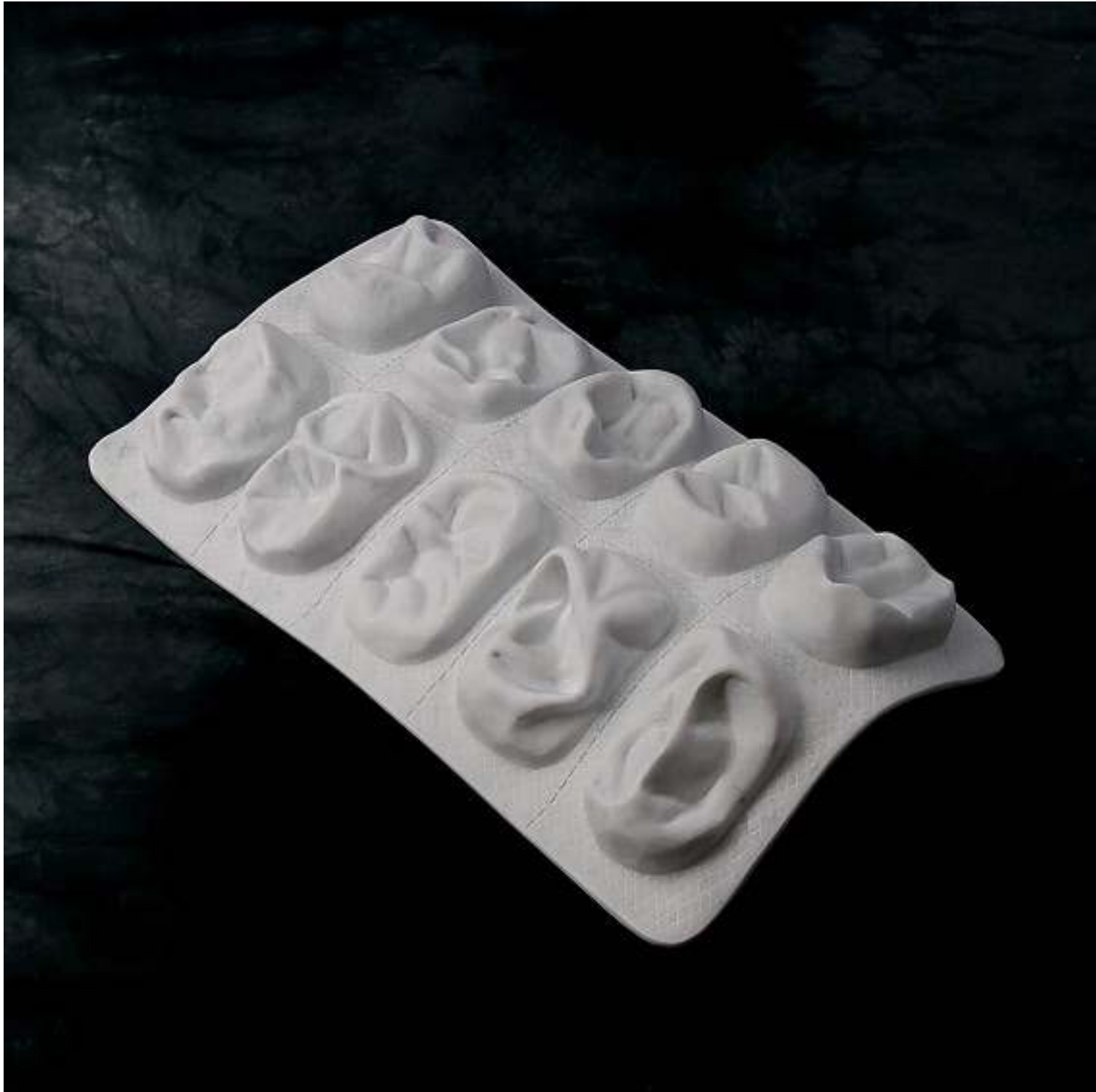
BLISTER 2 2009 marmo cm 65x35x20