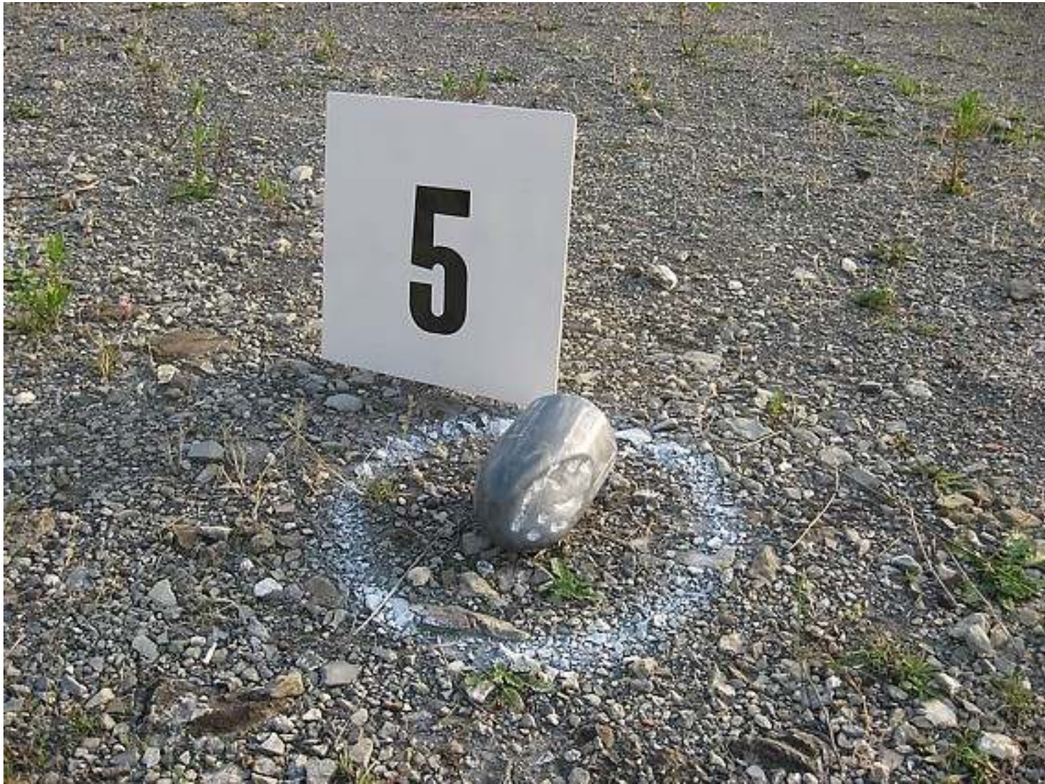
PROIETTILE particolare dell'installazione TI AMO, JE TAIME, Y LOVE YOU