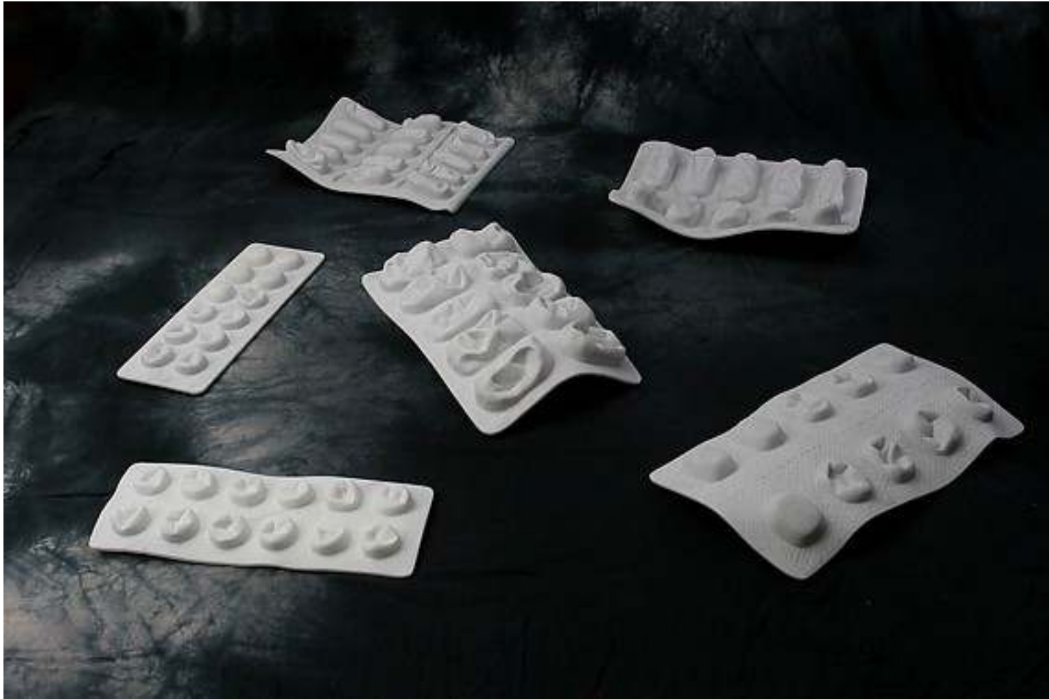
PSYCO SOCIETY 2009 installazione cm 350x350x20 marmo