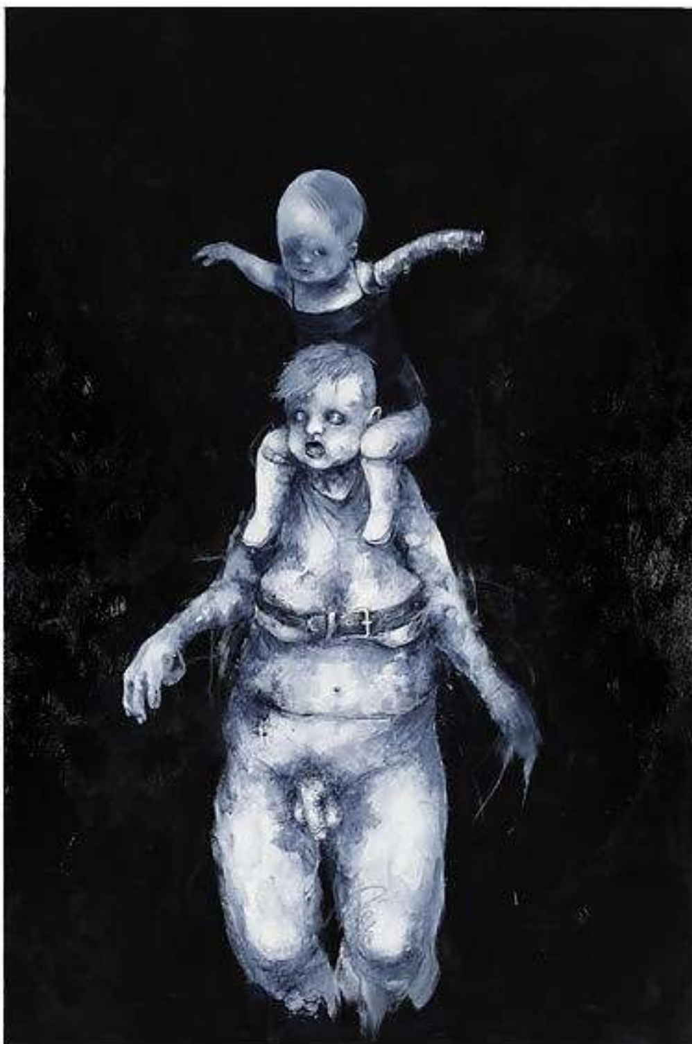
OSCENA MADRE ( IZA GRAU )