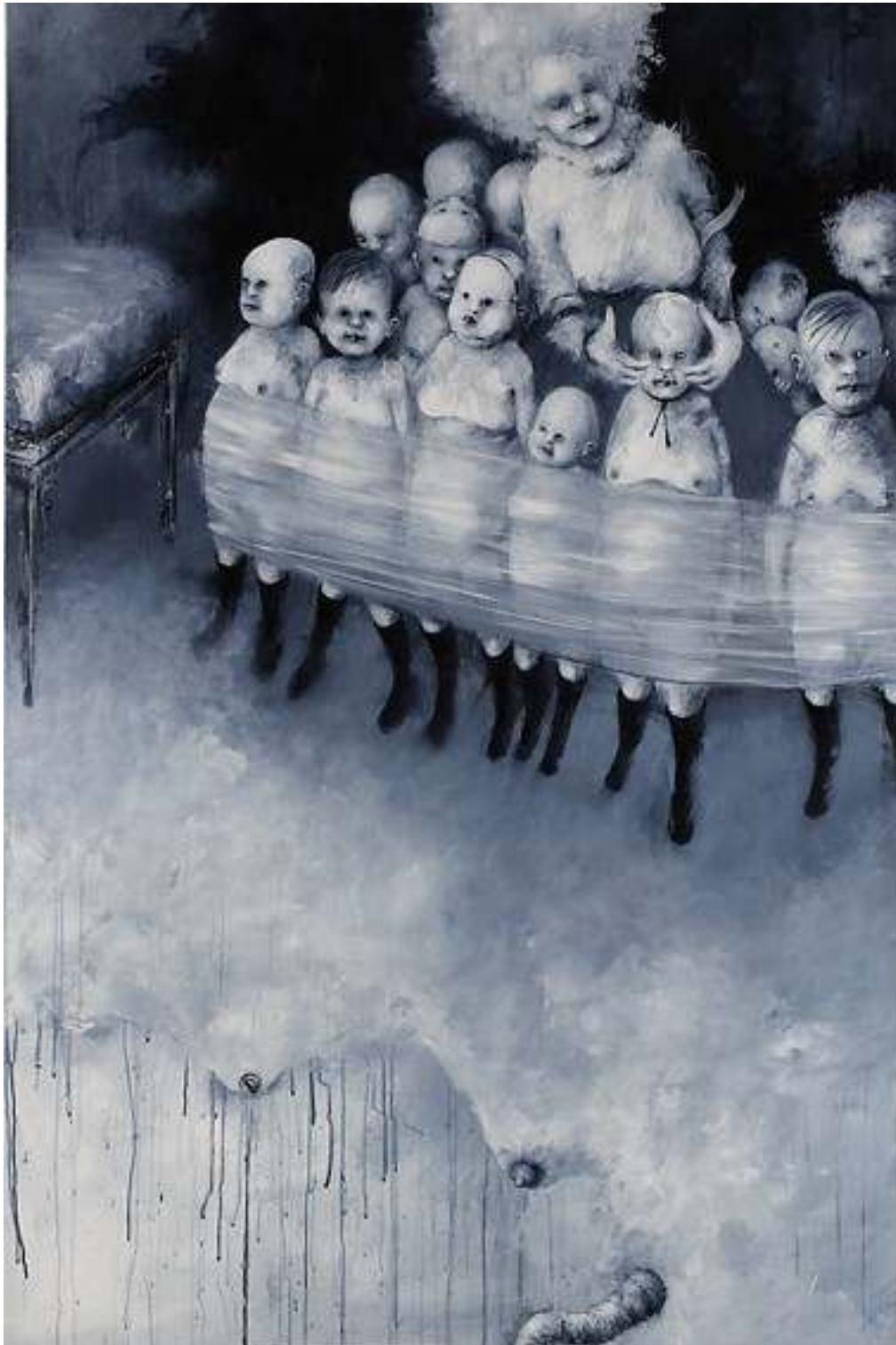
BIMBI BUONI VISITANO L'HELTER SKELTER