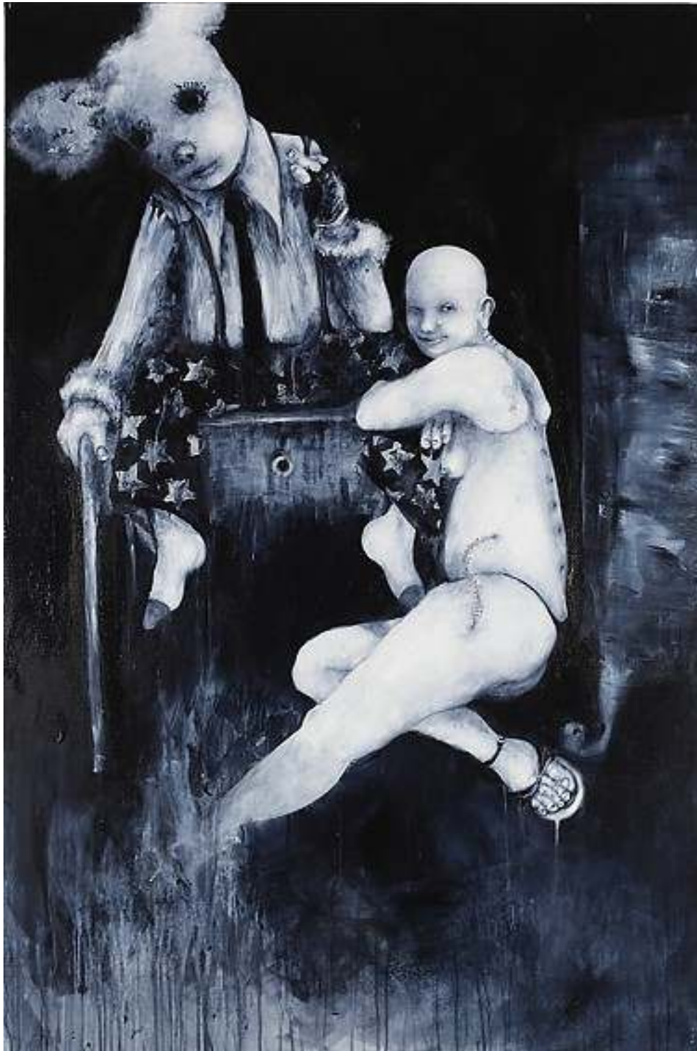
L'AMORE E' UN CANE DALL'INFERNO