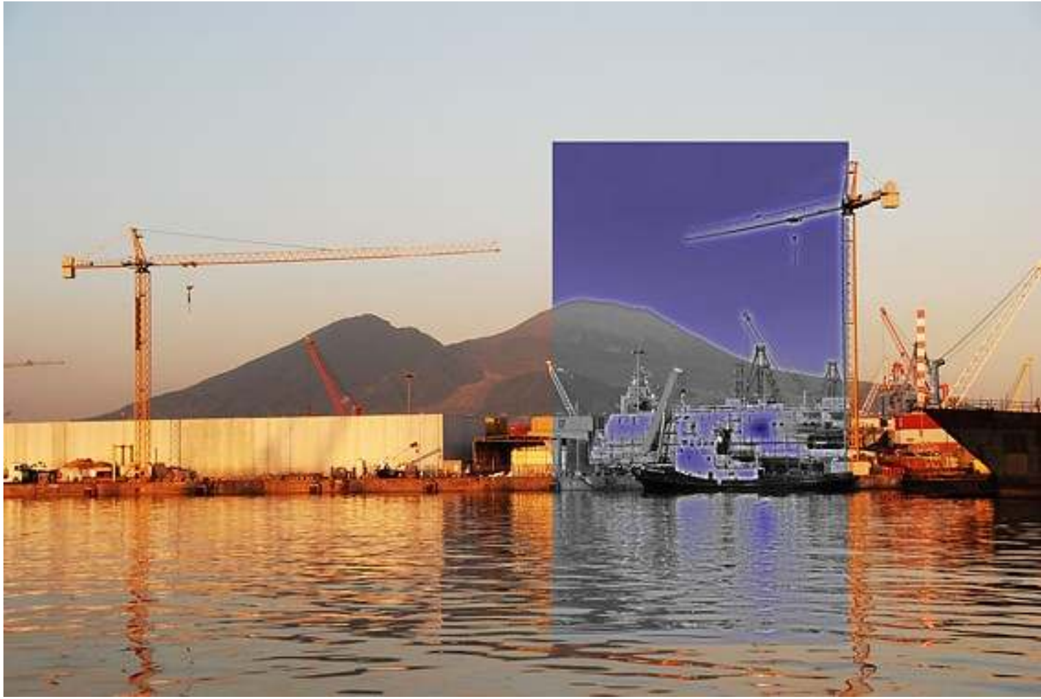
“yard 'n yard ”