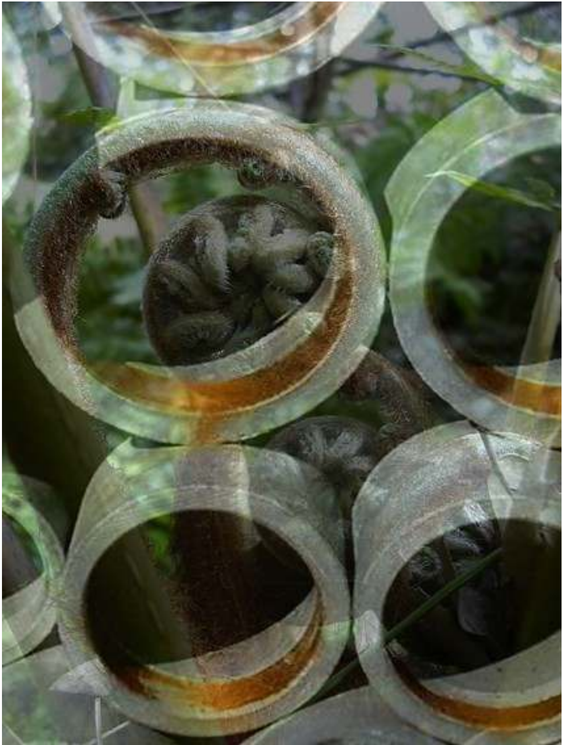
“Trap 2” Alluminium print