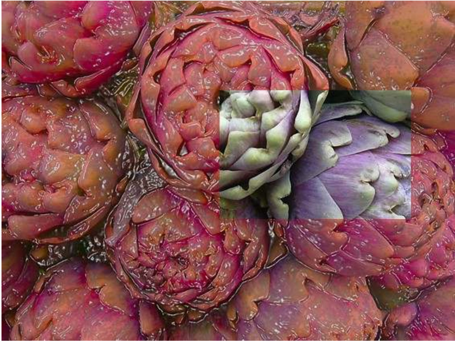
“trans genico #2” Alluminium print