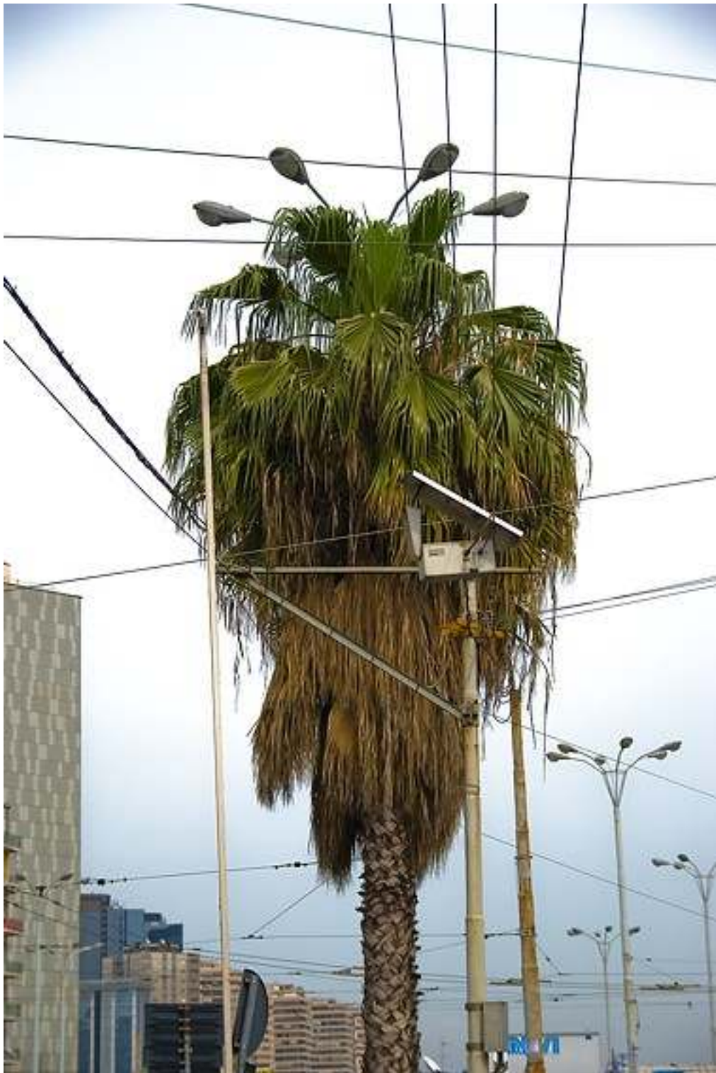
“NO TITLE #1” Light box - 100x67