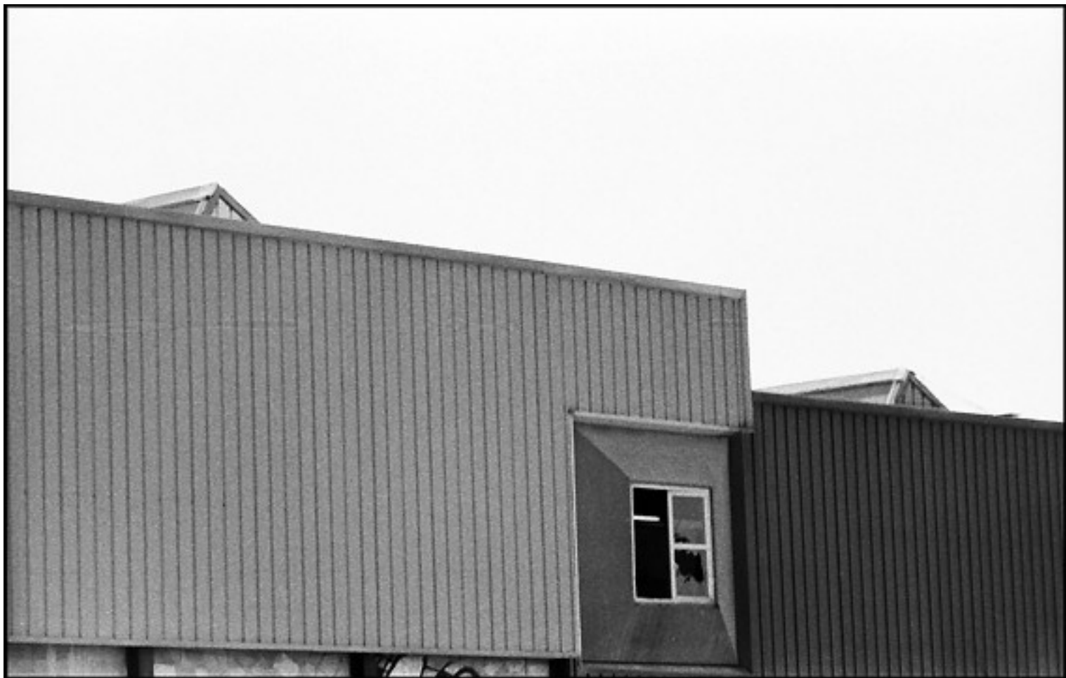
“VERTICALI” Print on cotton paper