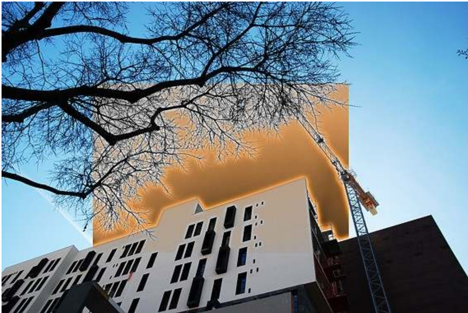
“el put xet ”