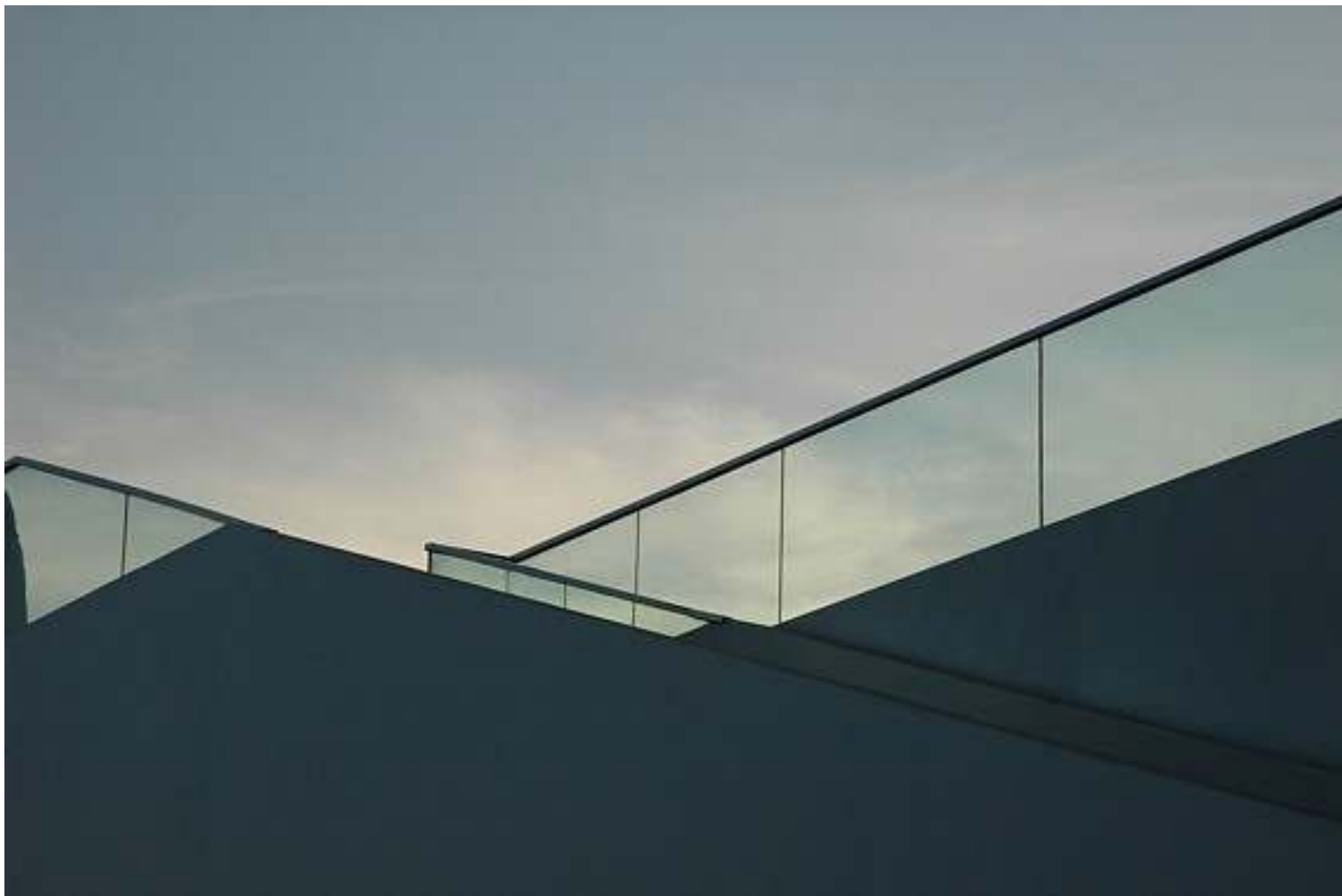
“senza titolo #2”