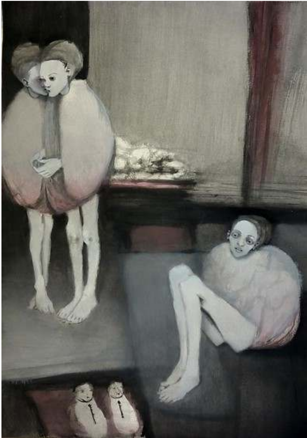
Il-confortevole-abisso-d tecnica mista su carta 45x65cm