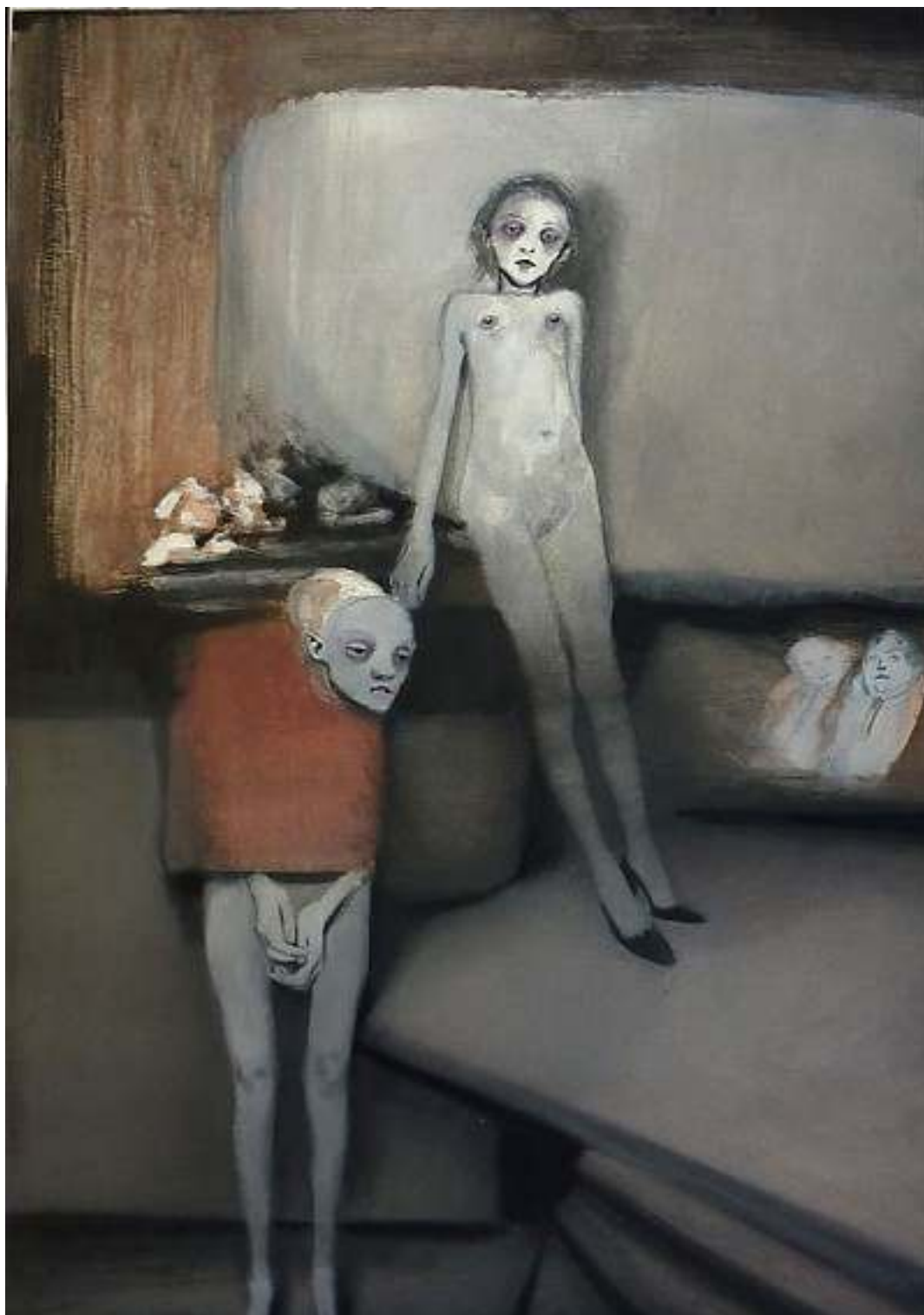
Serviti-e-riveriti tecnica mista su carta 45x65cm