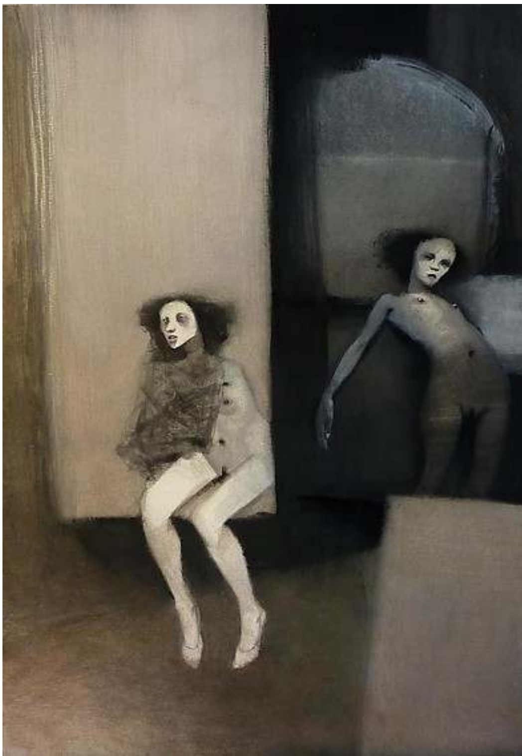
Esche-vive tecnica mista su carta 45x65cm