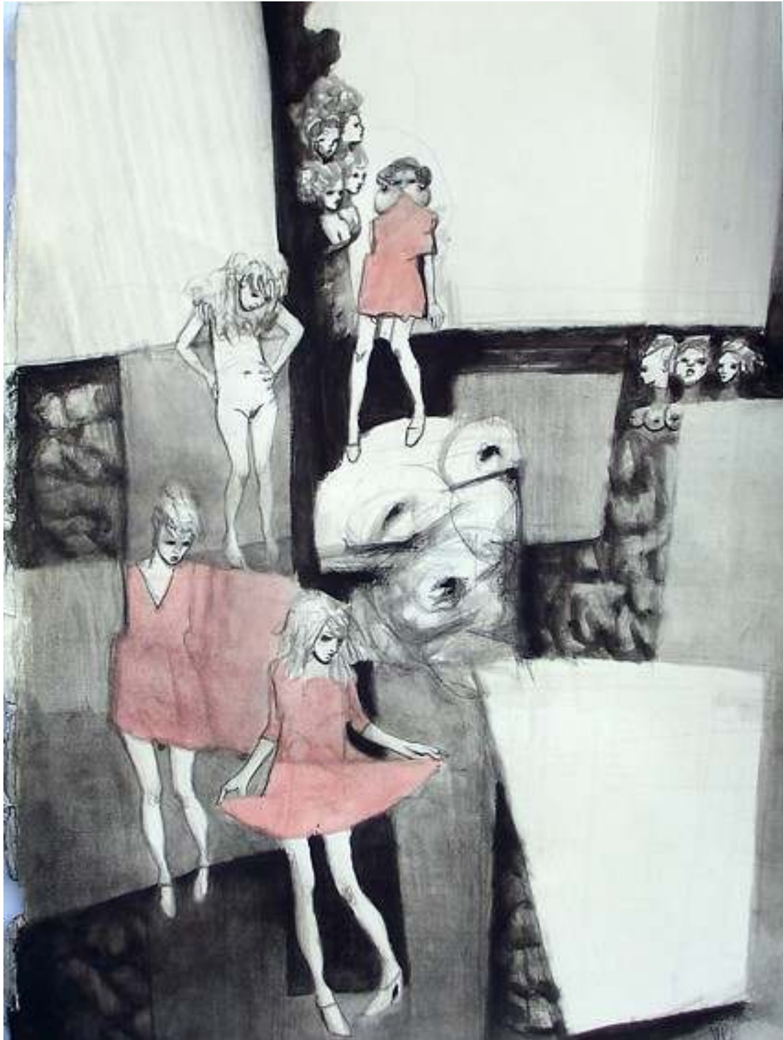
Le-Ragazze-come-entità-n tecnica mista su carta 50x70cm