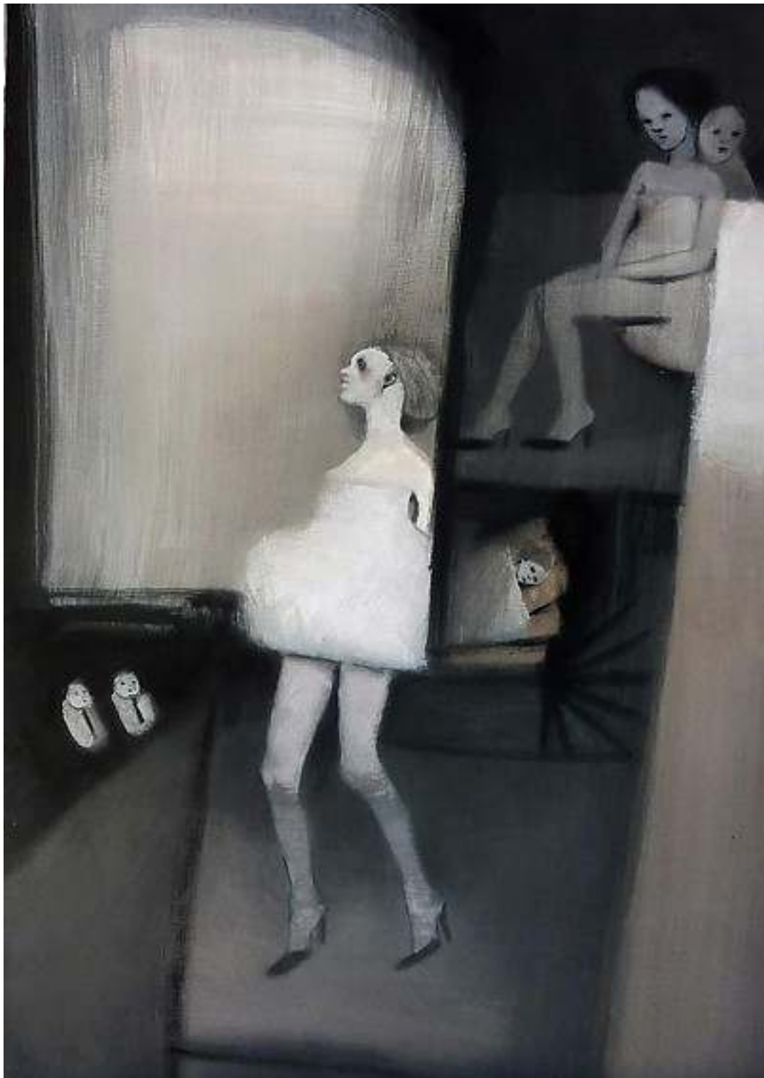
In-caso-d'incendio-aspet tecnica mista su carta 45x65cm