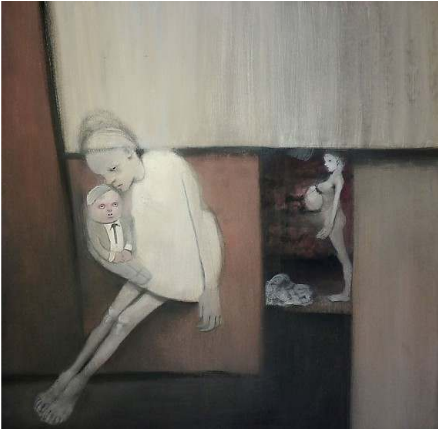
Piccolo-risparmiatore-so tecnica mista su carta 60x60cm