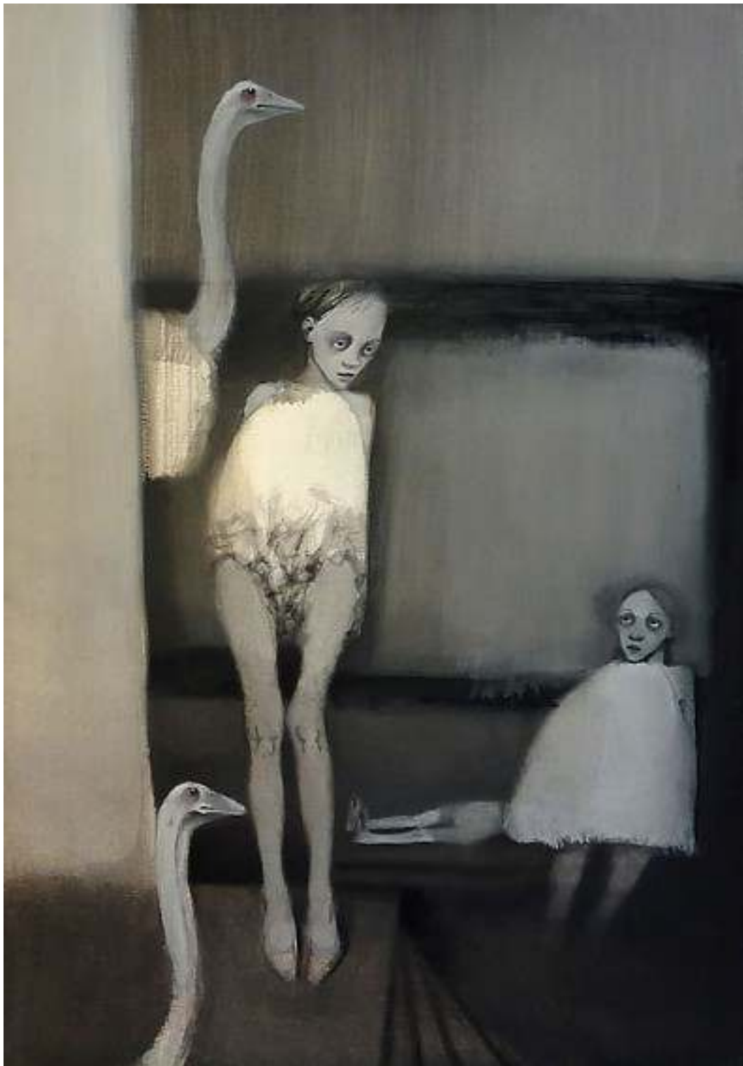
Più-fame-che-amore-#2 tecnica mista su carta 45x65cm