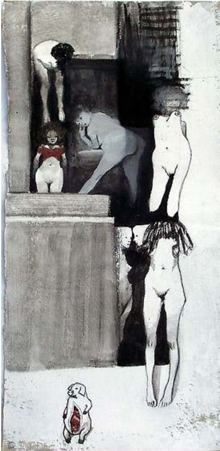
Cenere-al-posacenere tecnica mista su carta 70x30cm