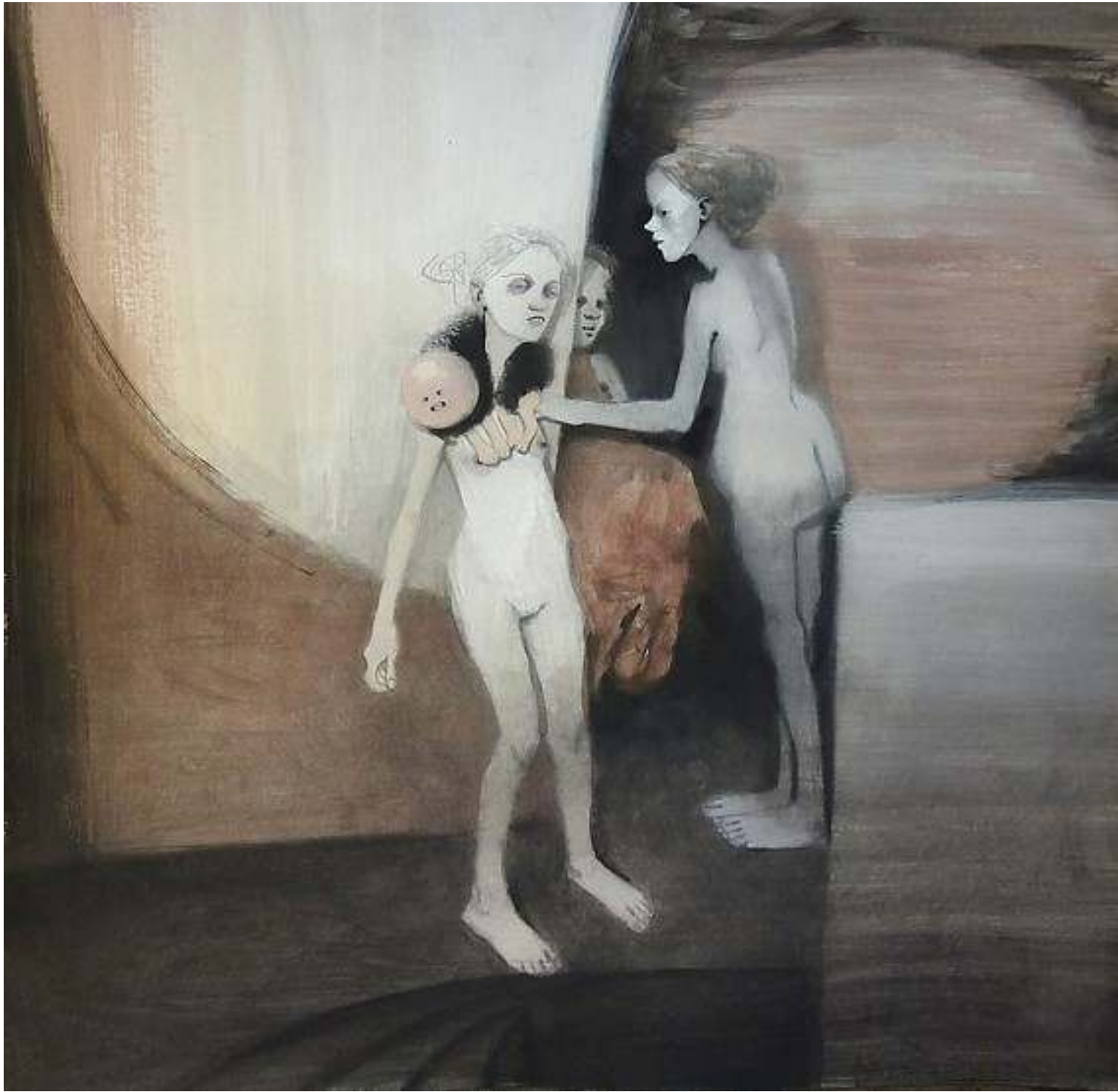
Belle-signore-pietà tecnica mista su carta 60x60cm